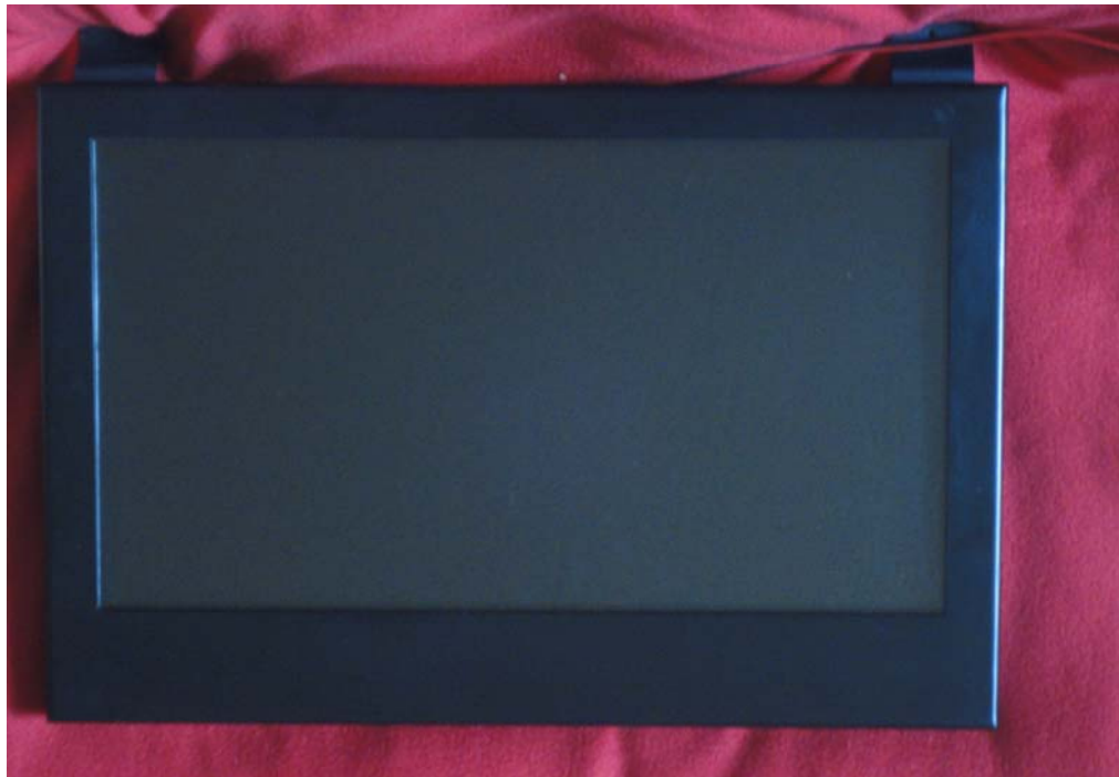
Para administrar Localmente sus pantallas requiere del Mini-Server